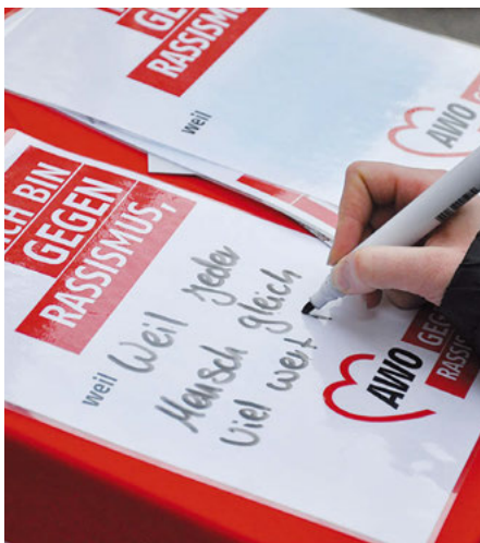
Passantinnen und Passanten konnten am Aktionsstand ihr Statement gegen Rassismus und für Vielfalt abgeben.

AWO-Info-Stand in der City am Tag gegen Rassismus