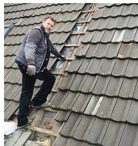
Auch das Dachgeschoss des „Baldushauses“ wurde ausgebaut.