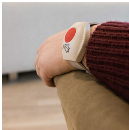
Anders als beim klassischen Hausnotruf-System funktionieren die Geräte der neuen Generation auch außerhalb der eigenen vier Wände.