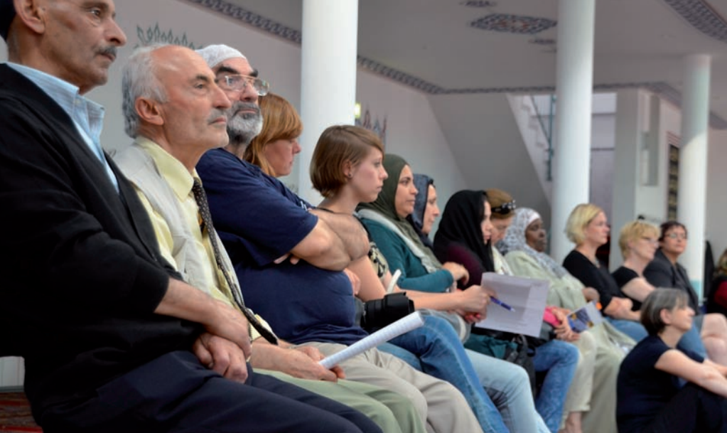
Großer Andrang auch in der Moschee in der Münsterstraße. Zahlreiche Besucher informierten sich über den Glaubensalltag der Muslime in Düsseldorf. Die Veranstaltung hatte die AWO-Integrationsagentur organisiert.