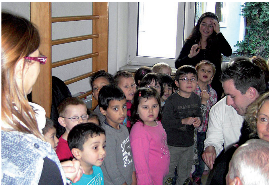
Konzentration vor dem großen Auftritt: Der Chor der AWO-Kita „Wackelzahn“