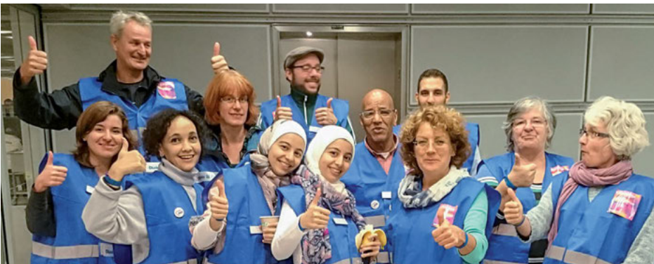
Trotz ihrer schwierigen Arbeit noch gut gelaunt: Die Ehrenamtlichen am Fernbahnhof sind oft bis spät in die Nacht im Einsatz.

AWO-Helferinnen und Helfer sind auch nachts im Einsatz