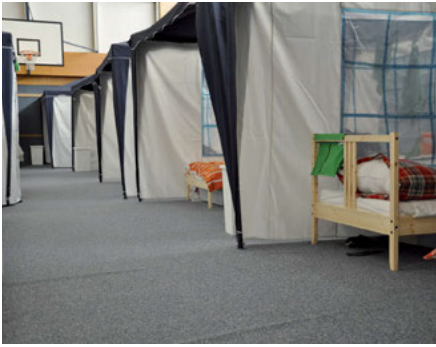
Die Pavillons, die in der Turnhalle im AWO Berufsbildungszentrum aufgebaut wurden, bieten den jungen Männern zumindest ein bisschen Privatsphäre. Jeweils zwei Flüchtlinge teilen sich einen Pavillon.

regelmäßig tagenden Runden Tisch der Stadt zum Thema „Flüchtlinge“. Hier wird gemeinsam über die aktuelle Situation beratschlagt.