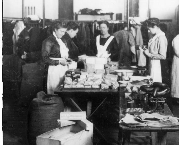
Marie Juchacz: Sozialreformerin, Sozialdemokratin, Frauenrechtlerin und Gründerin der AWO.